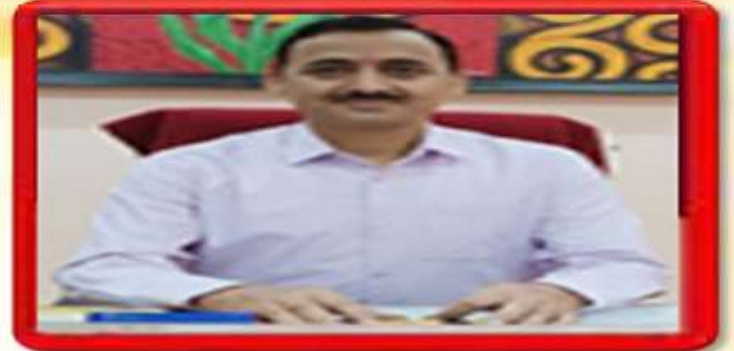
SHRI.ANUP AWASTHI ASST. COMMISSIONER KVS,LUCKNOW REGION